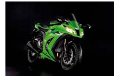
Lime Green / Ebony

Kawasaki's neustes Supersportbike bietet mit mehr Power den je und mit neusten Technologien ausgestattet die Basis um Strecke und Strasse zu dominieren.