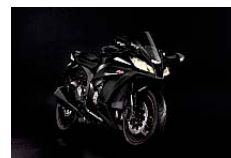
Ebony / Flat Ebony